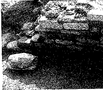
Un particolare del ritrovamento

TERAMO. La strada del metano incrocia quella dell'antichità. E dal tracciato del nuovo metanodotto vengono alla luce i resti di due antiche abitazioni di epoca romana. La scoperta è stata fatta in contrada Colli, ai piedi delle frazioni di Cerreto e Poggio Cono, pochi metri prima del bivio con la 150, e a Forcella, in contrada Feudo.