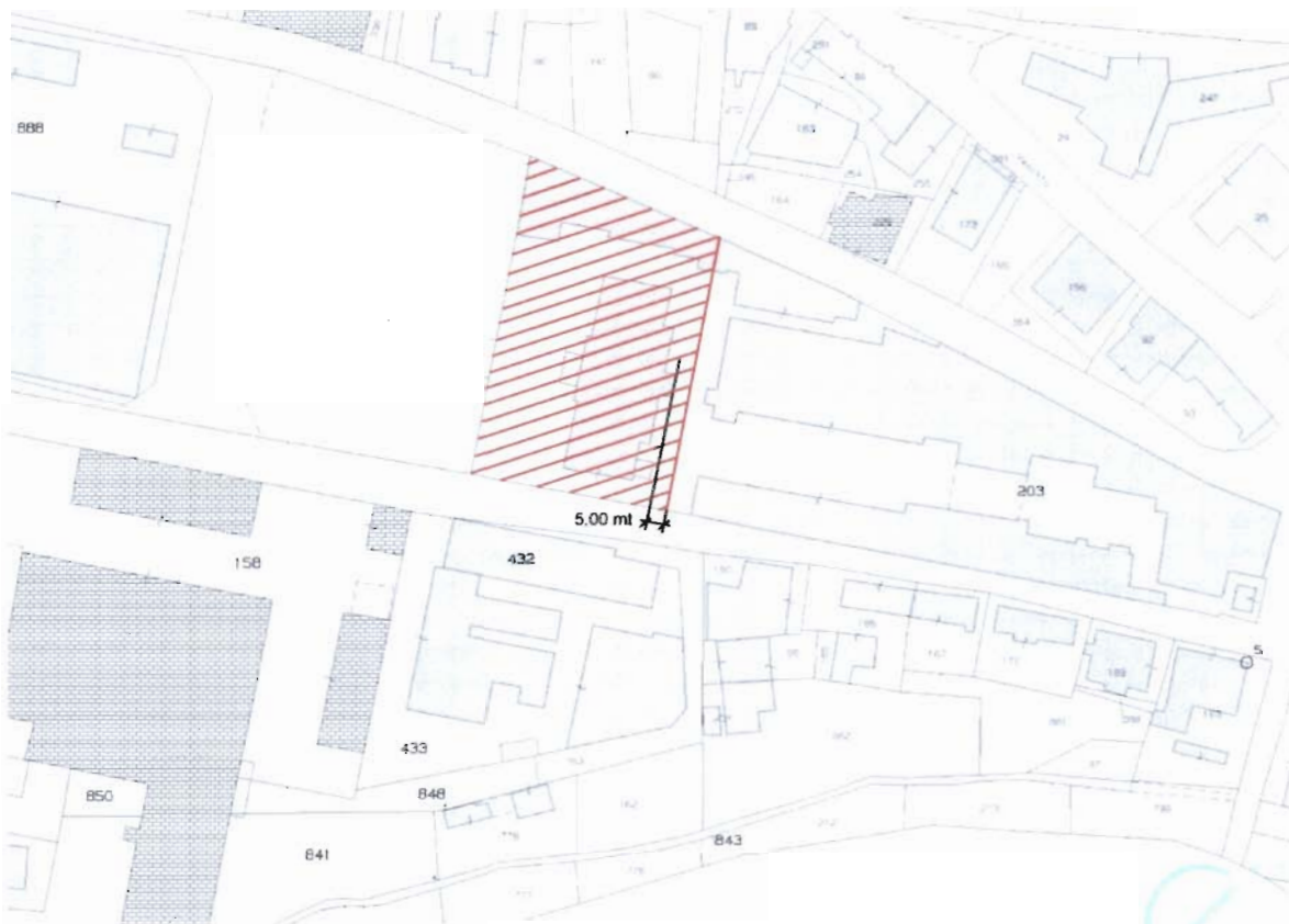
STRALCIO PLANIMETRIA CATASTALE FG. 70 P.LLA 203